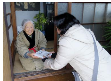
高齢者見守り活動事業