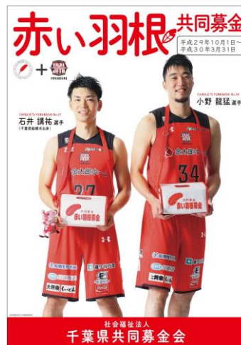
千葉ジェッツふなばしポスター