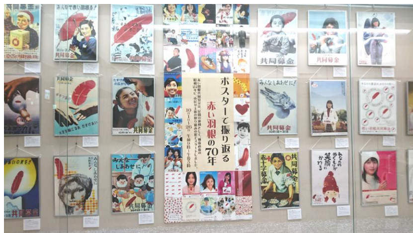
「ポスターで振り返る赤い羽根の70年」(流山市・森の図書館)