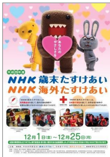
平成 29 年度 NHK 歳末・海外たすけあいポスター