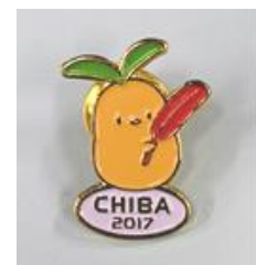
びわびよピンバッジ

また「びわびよ」を使用した支会独自の広報物を作成したり、ぬりえ大会などのイベントを実施した支会もあった。