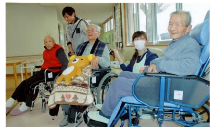
リクライニング車いすを助成