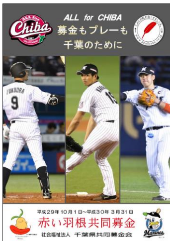
千葉ロッテマリーンズポスター