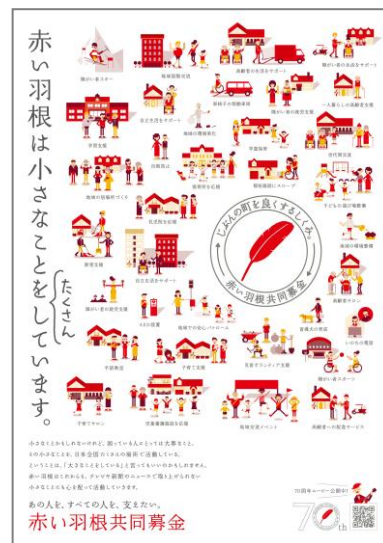
平成 29 年度全国共通ポスター

※「70 年答申」とは、中央共同募金会の「現代の地域福祉に関する需要、共同募金に対する資金需要に応えられる共同募金に生まれ変わるための方策」という諮問に対して、外部有識者からなる同会企画・推進委員会が平成 28 年 7 月に出した答申『参加と協働による「新たなたすけあい」の創造～共同募金における運動性の再生～』をいう。