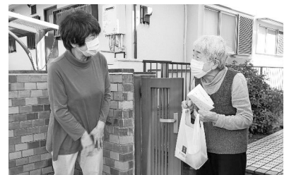
【高齢者見守り訪問】

令和4年度の千葉県の助成総額約5億7千万円のうち、約4億2千万円は市町村の身近な福祉のために助成し、約1億5千万円は県域の福祉のために助成しました。