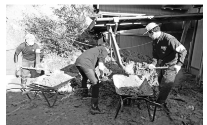
【令和元年度房総半島台風復興支援の様子】

令和元年度房総半島台風でも災害ボランティアセンターの設置や、被災地で復旧・復興活動を行うボランティア団体の支援のために県内25市町村で3,659万円が活用されました。