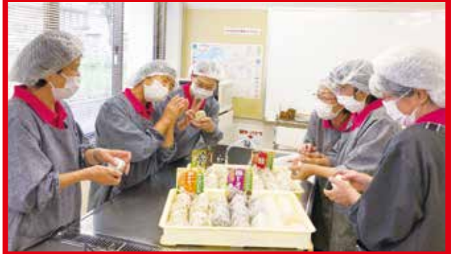
地域食堂コンパス(市原市)

「つながりをたやさない社会づくり」を目指して 企業の皆さまと地域の活動を応援していきます。