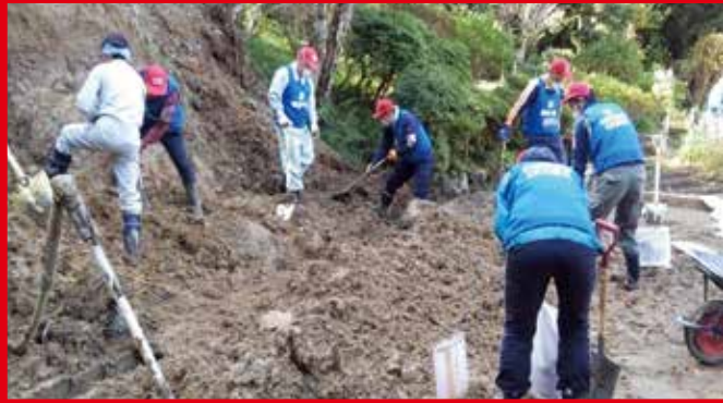
土砂の掻き出し作業(長柄町)

令和元年台風15・19号及び 10月25日大雨でのボランティア活動に 災害ボランティアセンターへの支援/災害対応