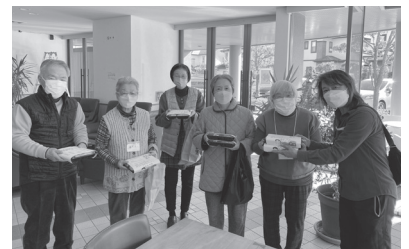
【75歳以上の世帯への配食事業】

令和6年度に千葉県で使われた募金額は約6億900万円で、そのうち約4億900万円は寄付をいただいた市町村の活動のために使われ、約2億円は県域の福祉活動に使われています。