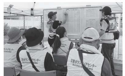
【災害ボランティアセンター運営訓練】

また、災害用備品の整備や防災訓練にも使われ、減災・防災の取り組みでも活躍しています。