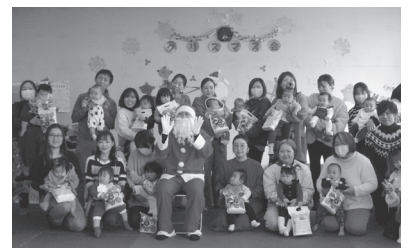
【子育て親子交流 “つどいの広場”】

地域のための民間財源である共同募金は、地域での孤立を防ぐため、子育て世代や高齢者・障がいを持つ方をはじめ様々な人たちがつながり合い・支え合う地域づくりのための支援を数多く行っています。