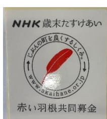
「はねっと」助成事業画面